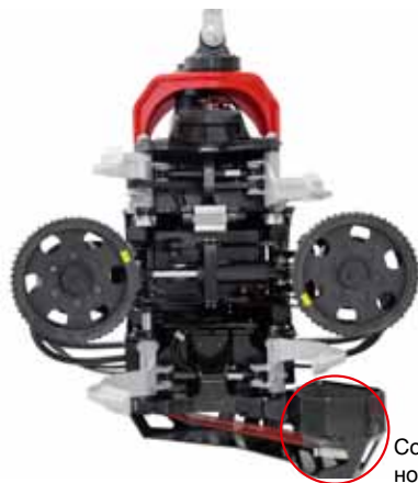
Совершенно новый блок отпила "Constant Cut"

Технические данные /размеры отличаются в зависимости от опции оборудования. Мы оставляем за собой право на изменения спецификаций или конструкций без предварительного предупреждения. Фотографии, диаграммы и эскизы не всегда показывают машину в стандартном исполнении.